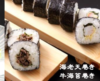
海老天巻き 牛海苔巻き