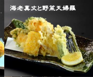
海老真丈と野菜天婦羅