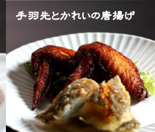
手羽先とかれの唐揚げ